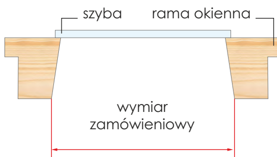
Przekrój okna Fakro